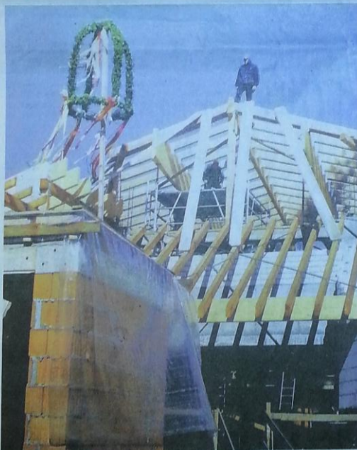
Zahlreiche Fotos erlauben einen Blick in die Vergangenheit, wie etwa hier beim Richtfest des Jona-Hauses.

So schildern sie etwa den Absturz eines britischen Bombers im Zweiten Weltkrieg. Oder sie erinnern an die Entstehung des Brockhausplatzes, den Bau des Jona-Hauses oder die Dreharbeiten zu Peter Thorwarths „Unna-Trilogie“. Auch berichten sie über die Zeche, die es hier einmal gab, den verschwundenen Minigolfplatz, oder den Teich an der Falkstraße, der zur Be-